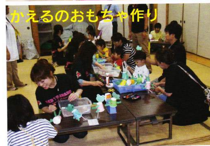
かえるのおもちゃ作り