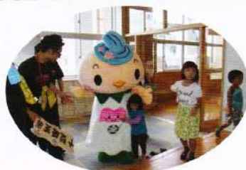
かんちゃんも遊びにきたよ