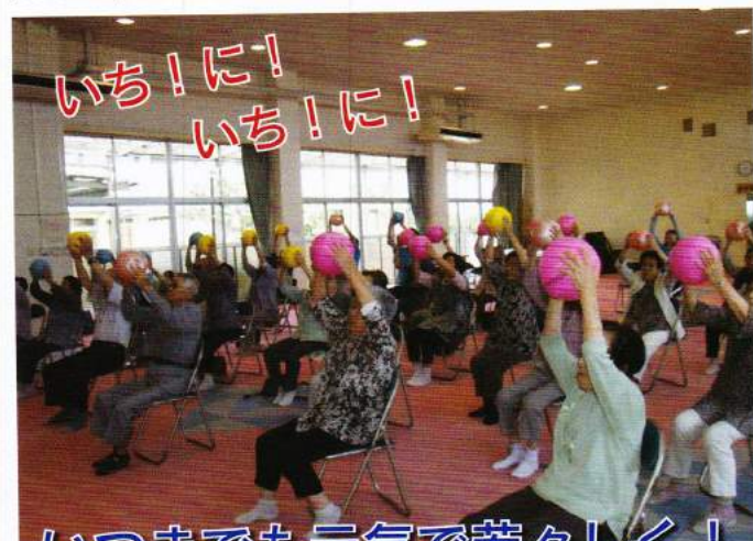
いつまでも元気で若々しく！

5月29日、千代田町福祉センターにおいて、さわやか生きがいの利用者の体力維持及び向上のための運動を行いました。