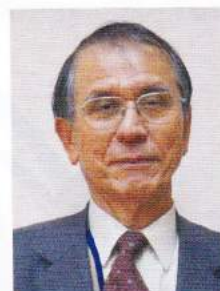
神崎市社会福祉協議会