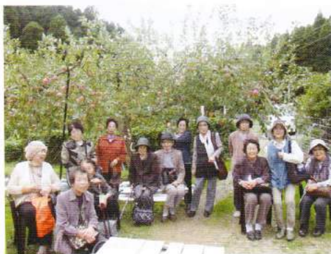
三瀬村へりんご狩り もぎたてリンゴはあまーい

認知症予防や健康維持の体操を行い、この他、バスハイクや各種イベントを楽しんでいただいています。その様子を紹介いたします。