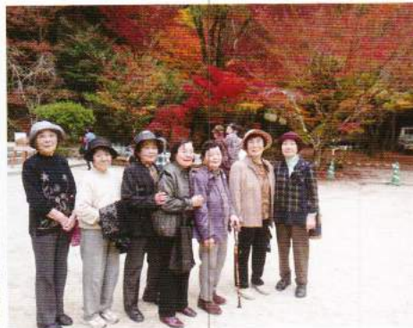
仁比山公園の紅葉見学