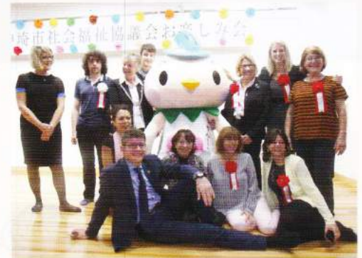
フランスからのお客様

フランスの飛行家ジャッピー氏は、パリ～東京間を100時間懸賞飛行の途中、昭和11年11月19日に神崎市脊振町に墜落。しかし消防団員と地元の人々の素早い捜索と救出活動により奇跡的に救出。救出から60年後の平成8年に旧脊振村とボークール町が友好姉妹都市関係を結び、町村合併のあった今も神崎市とボークール市の友好姉妹都市提携は続き20周年を迎えています。