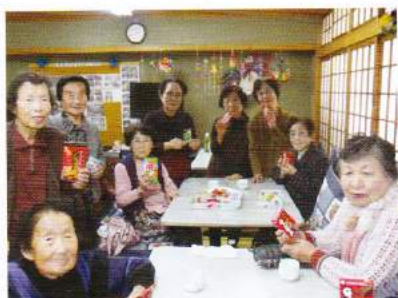
つかさ神崎店様よりお菓子を頂きました。おいし～ ありがとうございます！