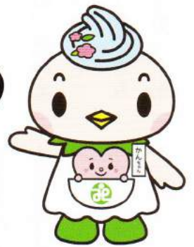
マスコットキャラクター かんちゃん