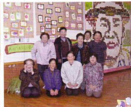
脊振森林の里文化フェスティバルへの作品出品