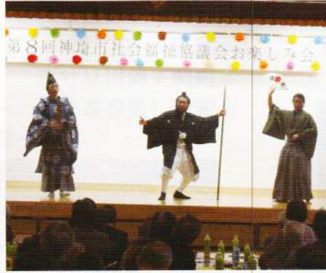
佐賀の八賢人 おもてなし隊