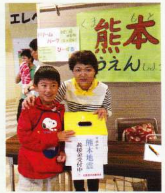
子どもまつり実行委員会より 義援金 25,415円

佐賀県共同募金会神崎市支会に寄せられた義援金は6月30日現在で5,609,793円となっています。