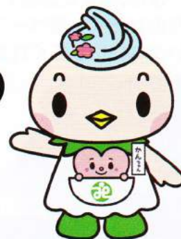
マスコットキャラクター かんちゃん