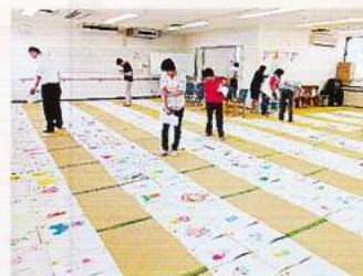
一次審査会の様子