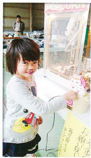
元気かんだき市民交流祭 イベント募金