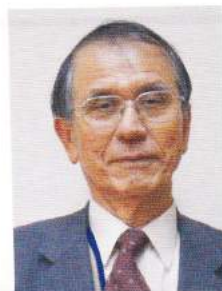
神崎市社会福祉協議会