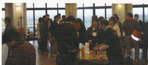
ディナーバイキング