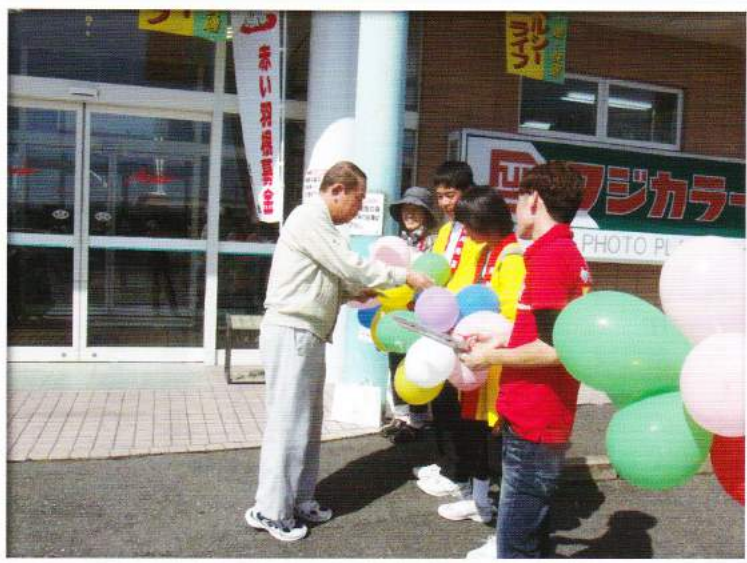
市内スーパー 街頭募金