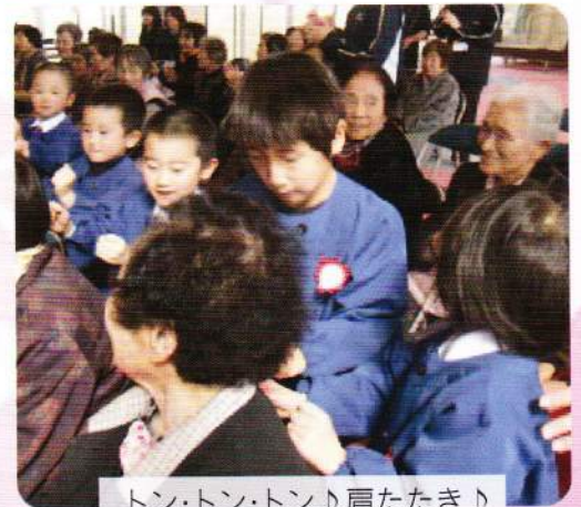
トン・トン・トン♪肩たたき♪

3月5日、千代田町福祉センターにて生きがいデイサービス三地区合同お楽しみ会を行い、せふり保育園年長児によるお遊戯などを楽しんでいただきました。