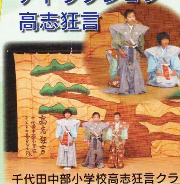
千代田中部小学校高志狂言クラ