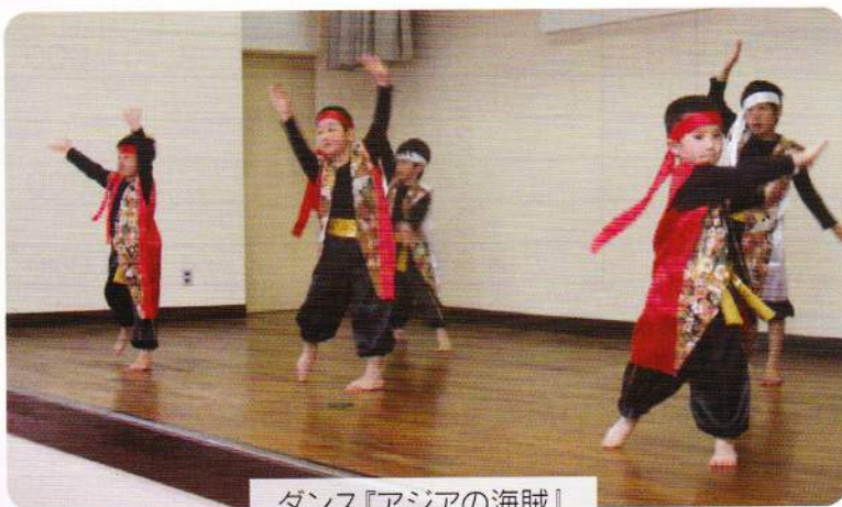
ダンス『アジアの海賊』