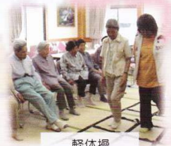
軽体操 ふまねっと