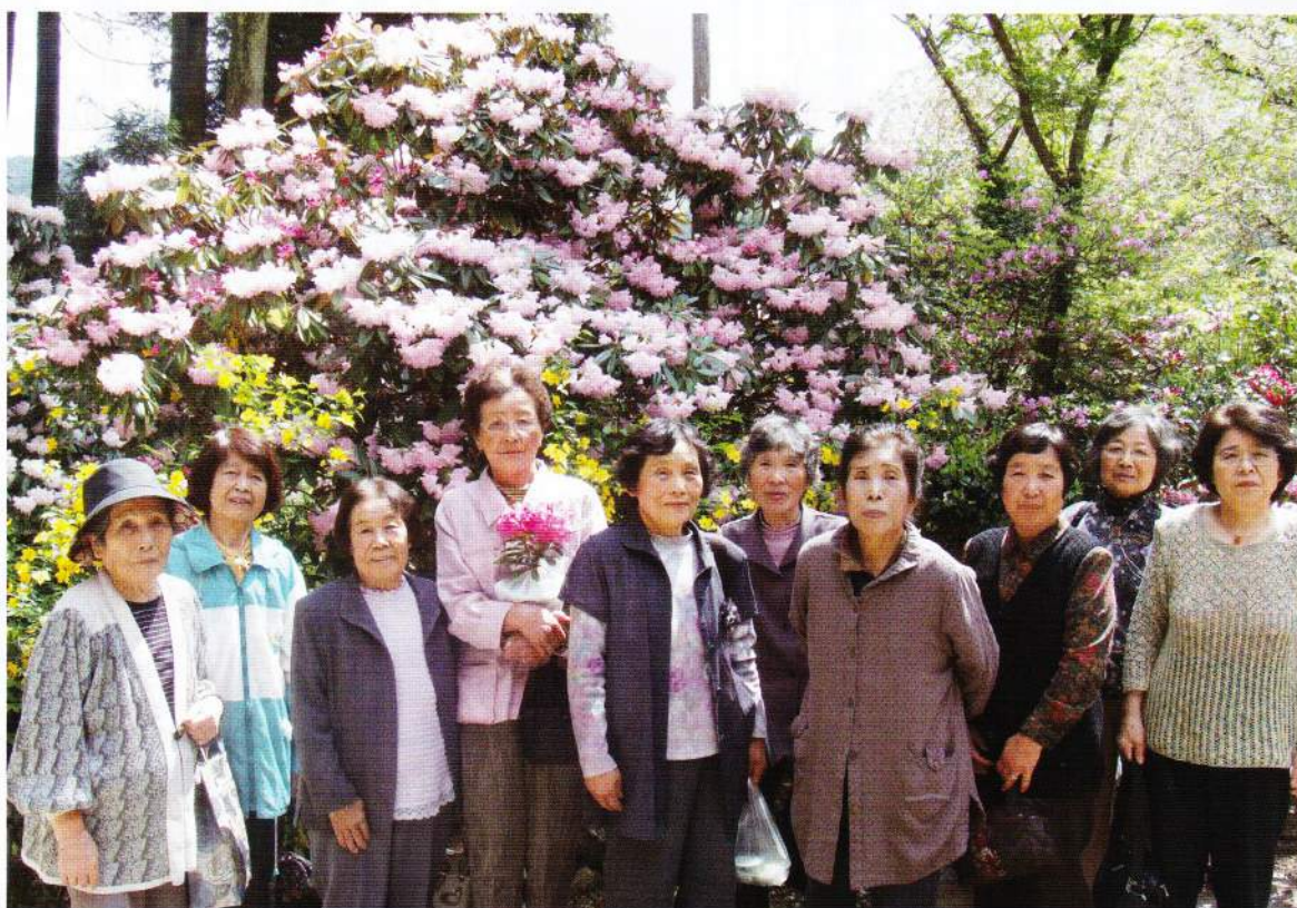
(千代田町黒井・丁太田・上地地区)