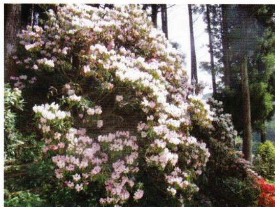
樹齢400年の弁財天シャクナゲ (見頃4月下旬)

神崎市(脊振・神崎・千代田)の生きがい サービスでは、バスハイクとして、脊振 町久保山の浄徳寺(別名シャクナゲ寺)へ シャクナゲの観賞へ行きました。