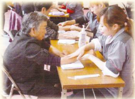
ハンドマッサージ お肌すべすべ♥